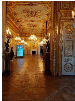
Salon d'honneur et salle de bal