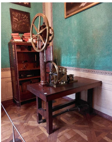
« Laboratoire »