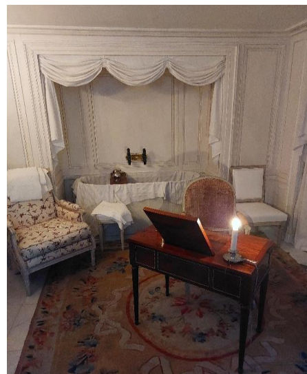
Salle de bain