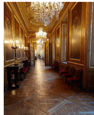
Galerie des ports de guerre

Cet Hôtel somptueux mérite votre visite, malheureusement il vient de fermer en janvier 2023 en raison d'un incendie qui a débuté dans un local technique et a ravagé une partie de la toiture. Heureusement, les appartements des intendants et les salons de la Marine n'ont pas été atteints.