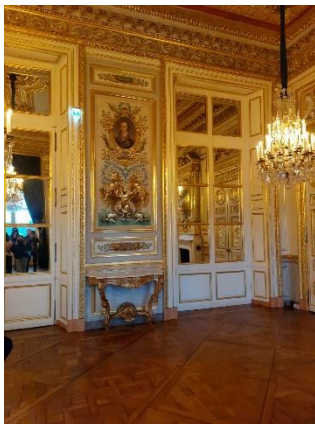
Salon des amiraux

Ces pièces ont été transformées à partir de 1843 et ont conservé les dorures des salons d'honneur de la Marine. On peut y admirer le bureau du chef d'état-major de la Marine, la salle de bal aux décors fastueux, la galerie des grandes préfectures maritimes françaises avec les portraits des grands marins et corsaires.