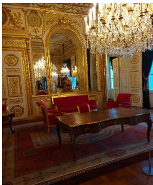
Bureau du chef d'état-major de la Marine