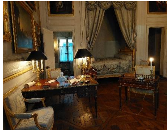
Chambre à coucher

Le parquet en bois précieux (acajou, ébène, bois de rose, citronnier) date du temps de la Marine