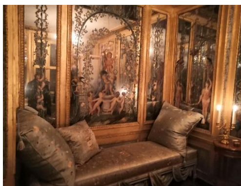
Cabinet des glaces