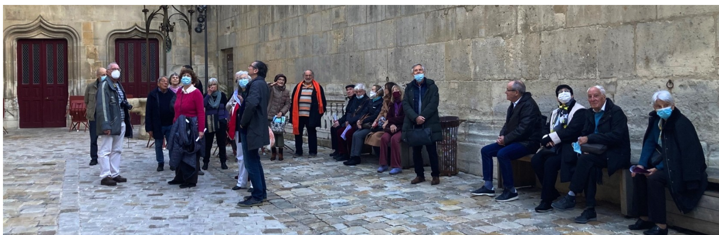
La cour de l'Hôtel de Cluny (M-R.V)