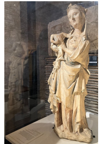
Notre-Dame du Palais (M-R.V)