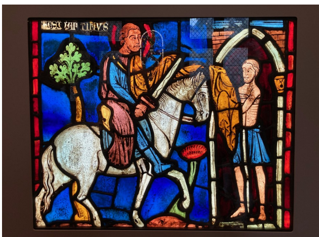
Vie de Saint Martin. Vitrail XIII ème siècle