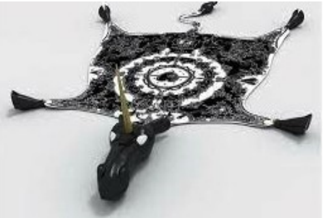
La « Peau de licorne » (Cité de la tapisserie-Aubusson)

La « Peau de licorne » mêle en deux couleurs majeures, le noir et le blanc, les deux arts propres à la région, la tapisserie et la porcelaine, puisque le corps de la licorne est en tapisserie alors que la tête, les sabots, et la queue sont en porcelaine. À propos de son œuvre, Nicolas Buffe écrit « J'ai conçu un projet représentant la dépouille de la licorne. Dans ce geste quelque peu iconoclaste de tuer le symbole pour le régénérer, j'espère imprimer la marque d'une nouvelle époque pleine de créations stimulantes pour Aubusson, mais aussi pour la tapisserie française. »