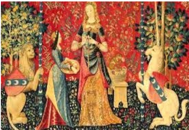
La « Dame à la licorne » (Musée de Cluny-Paris)

Perpétuer cet art, le rendre vivant pour les générations futures, former des lissiers, tel est le but de la Cité internationale de la tapisserie et de l'art tissé d'Aubusson. A ce titre elle lance annuellement un appel pour la création de maquettes de tapisseries contemporaines. La « Peau de licorne » de M. Nicolas Buffe est l'œuvre lauréate de 2010. Ses œuvres sont composées de décors empruntés à l'ornement du XVI ème , XVII ème et XVIII ème siècles (maniériste, baroque ou rococo) mêlés à des personnages issus de la bande dessinée ou de films d'animation.