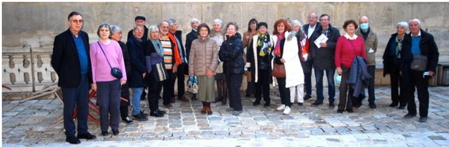
La cour de l'Hôtel de Cluny (M-R.V)