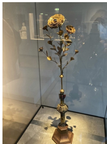
Rose d'or. XIV ème siècle (E.R)