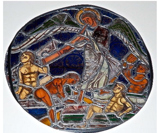
Vitrail Sainte-Chapelle (E.R)