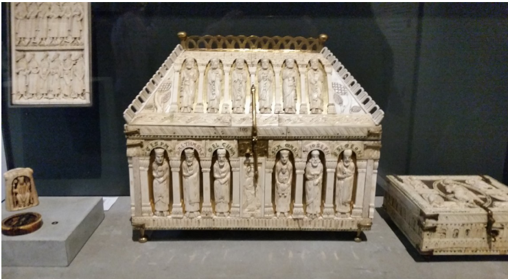
Chasse-reliquaire en ivoire. XII ème siècle (D.D)