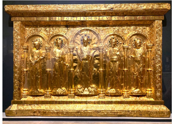
Devant d'autel en or. XI ème siècle (M-R.V)