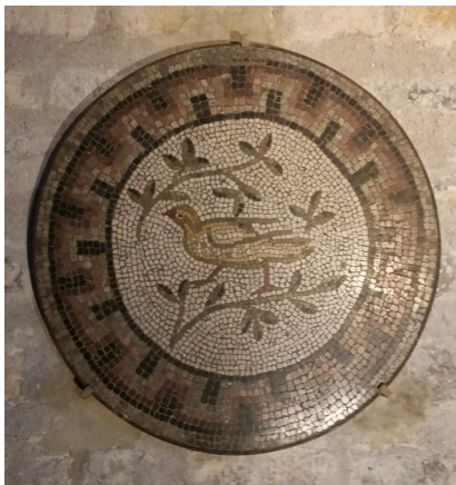
Thermes. Carreau de sol (D.D)