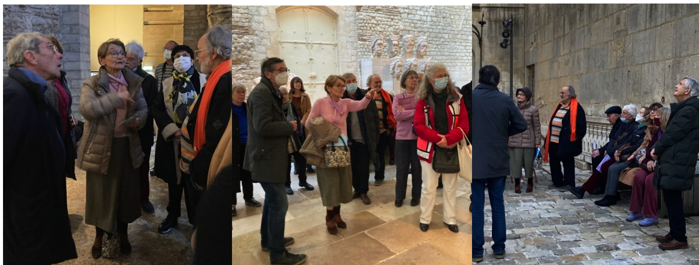
Les thermes et la cour de l'Hôtel de Cluny (M-R.V)