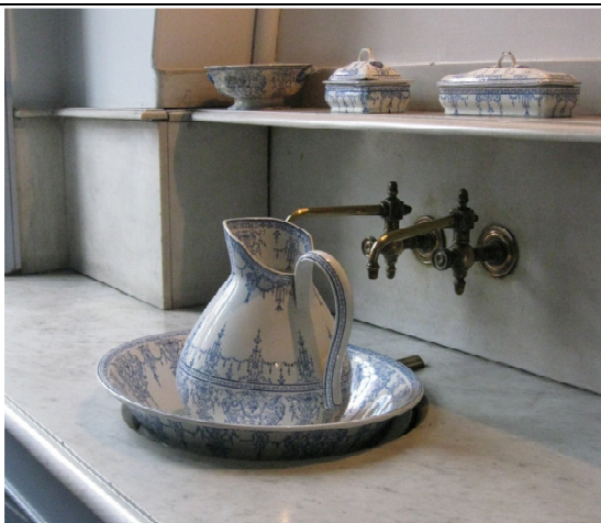
Une baignoire est située juste à côté du lavabo

La visite se poursuit par les chambres de Louis Pasteur, de Madame Pasteur et de leur salle de bains situées au premier étage. Tout est resté figé comme au début du 20ème siècle.