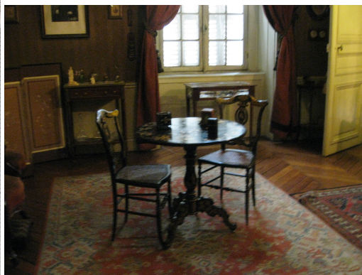
Chambre de Madame Pasteur

Au mur tableau montrant une séance de vaccination contre la rage