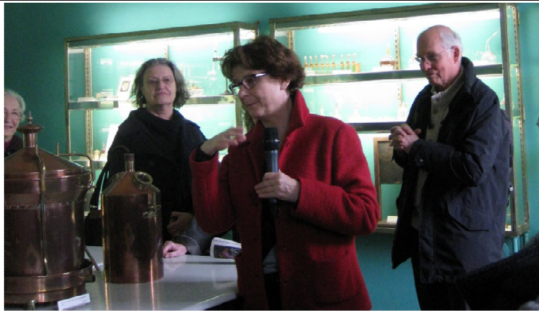
Autoclave utilisé par Pasteur