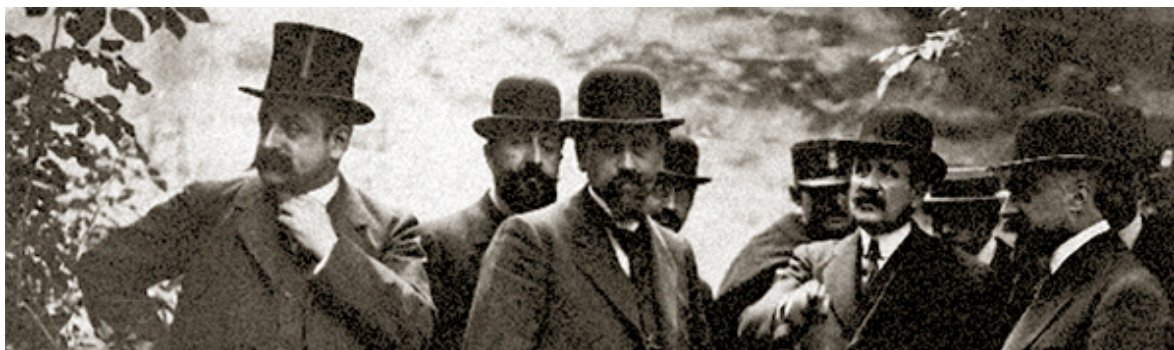
Dans l'affaire de la « bande à Bonnot », le procureur, le juge d'instruction et le médecin légiste sur les lieux d'une fusillade.