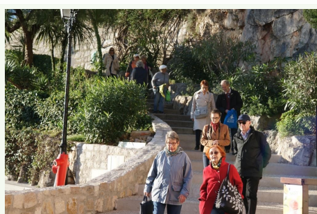
Arrivée à la station

Parmi tant d'émotions - des peintres (Matisse, Chagall, Ludovico Brea) à l'enthousiasme d'une doctorante devant ses méduses, de la socca dans le Vieux-Nice aux Russes qui créèrent la station marine en 1885- je retiens le palais Lascaris, des XVII e et XVIII e siècles, moins pour sa collection d'instruments de musique que pour son architecture, son décor et pour le poids de l'Histoire.