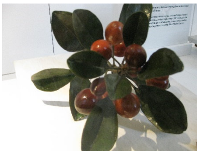
Reconstitution en cire

Cette collection unique au monde permet à de nombreux étudiants d'effectuer des recherches. Un site lesherbonautes.mnhm.com permet d'accéder aux herbiers numérisés.