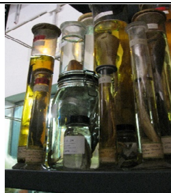
des poissons dans leurs bocaux pleins d'alcool